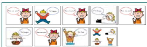
【英語ノート準拠】 会話 絵カード