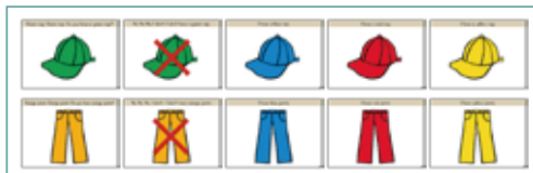
【英語ノート準拠】 チャンツ 絵カード

チャンツと異なり、ひとつの文章ごとにページ(絵カード)が出来ていますので、進むスピードは思いのまま。また、同じページを表示したまま音声のみを繰り返し再生することもカンタンにできます。